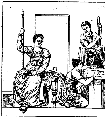
Personnage dictant à un secrétaire. (D'après une peinture d'Herculanum).

13-15. Deux recommandations pressantes. — Vos autem... Paul revient à ceux de ses lecteurs qui ne méritaient pas le précédent reproche, et qu'il avait déjà interpellés directe-